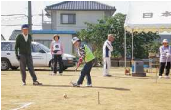
▶町ゲートボール大会