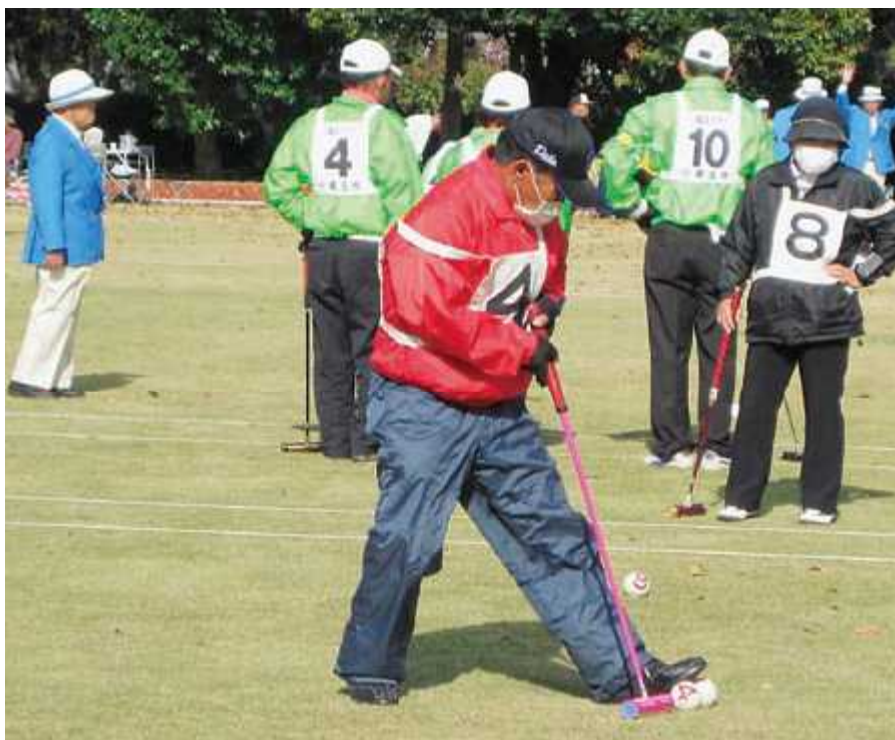
いばらきねんりんスポーツ大会