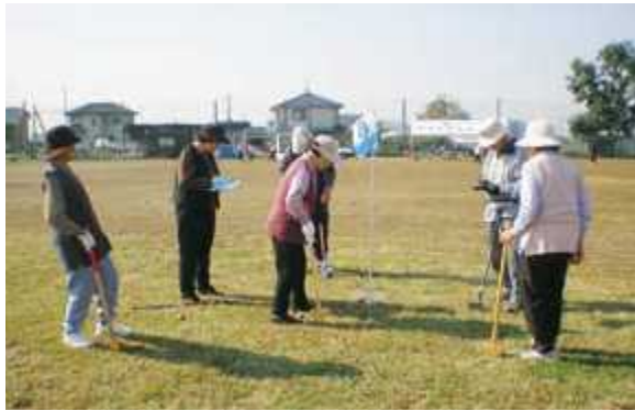
▶町グラウンドゴルフ大会