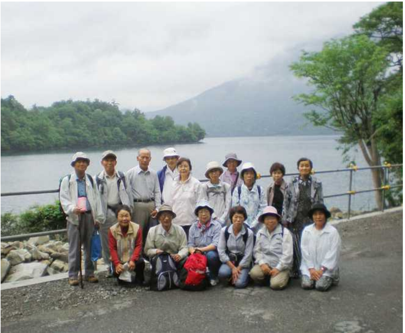
ハイキング講座（日光にて）